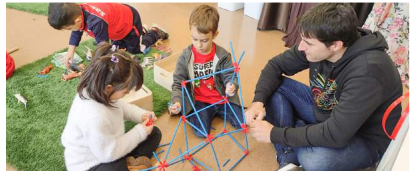
Construïm idees: Donem forma a les idees amb un munt de materials... Imaginació al poder!!