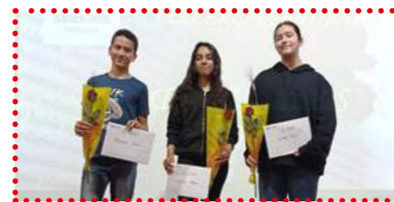
Premiats 1r d'ESO