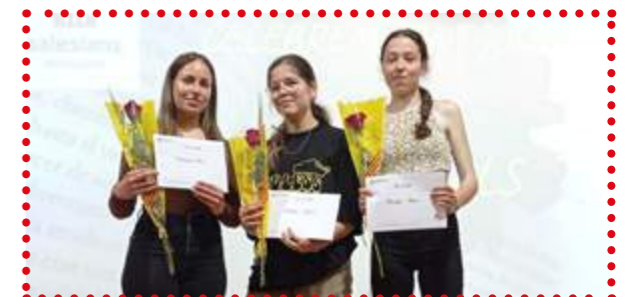
Premiats 4t d'ESO