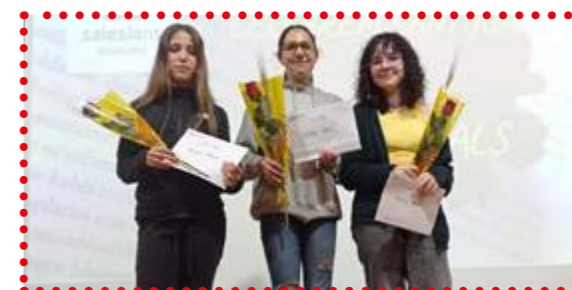
Premiats 2n d'ESO