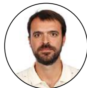
Oriol Pipó Mestre EP