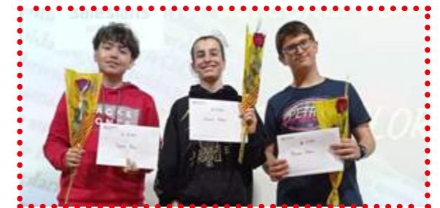
Premiats 3r d'ESO