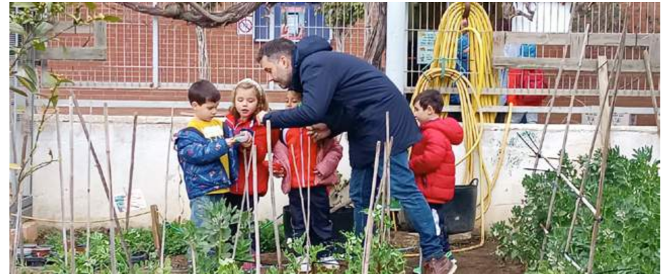
L'activitat d'hort: ens apropem al món natural i a l'alimentació saludable